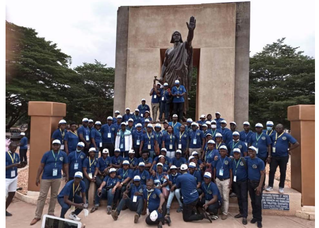
...une originalité de cette édition

Après l'étape de Porto-Novo, cap a été mis sur la ville historique d'Abomey où les agents ont découvert l'histoire des rois d'Abomey, fiers guerriers de tous les temps et dépositaires de la culture pérennisée par leurs descendants