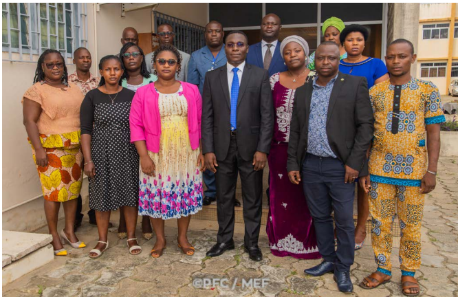
Photo de famille du personnel de la DAMF

La Direction générale du Trésor et de la Comptabilité publique, à l'instar des autres directions techniques du Ministère de l'Economie et des Finances, a mis en œuvre plusieurs réformes dans plusieurs secteurs. Est-ce que la DAMF en a initié en ce qui concerne les autorisations de change pour l'amélioration de ce service ?