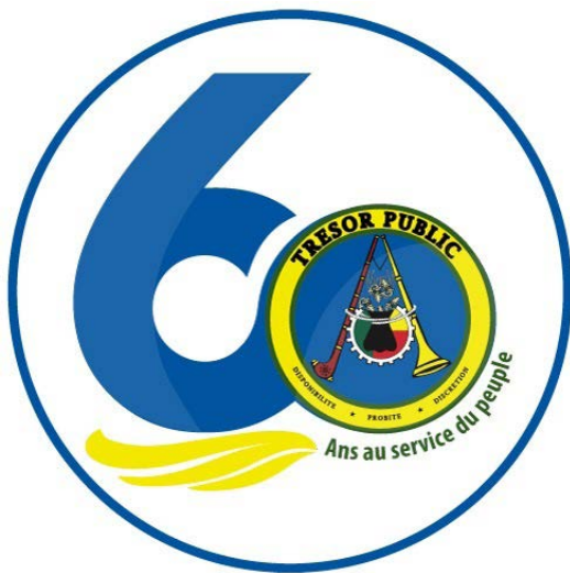
Le logo de la célébration

Le 14 août 2021 marquait les soixante ans d'existence du Trésor public du Bénin, un grand moment de fête et de réjouissances avec un contenu très achalandé. L'évènement qui s'est déroulé à la direction générale à Cotonou et simultanément dans tous les départements du pays a connu la participation des autorités du ministère en charge des Finances, des retraités de l'administration du Trésor et des clients venus de tous horizons. Différents moments forts ont marqué les festivités, du lancement le jeudi 12 août à l'apothéose le samedi 14.