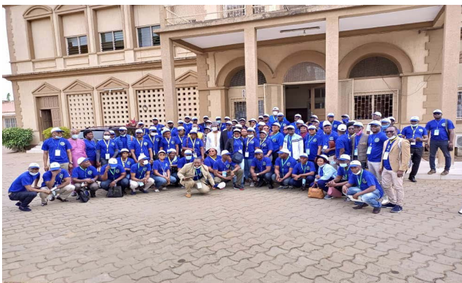
La sortie touristique du personnel ...

E n prélude à la commémoration des soixante ans de leur administration, les agents du Trésor public toutes catégories confondues, dans une ambiance bon enfant ont été plongés dans l'histoire