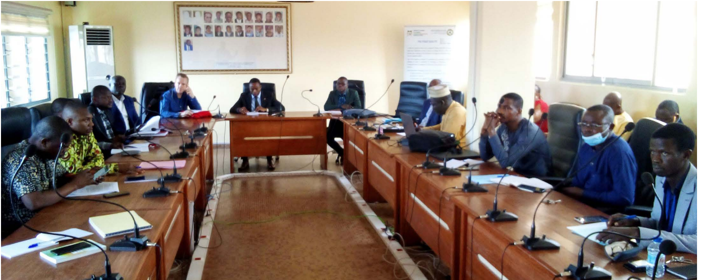
Les participants à l'atelier de validation

Le répertoire des innovations de la Direction générale du Trésor et de la Comptabilité publique (DGTCP) a été enrichi ce mardi 28 juin 2022 par l'organisation d'un atelier de validation du « Guide d'élaboration de la note de conjoncture sur les finances locales » et de la note de conjoncture sur les Finances locales du premier semestre 2021.