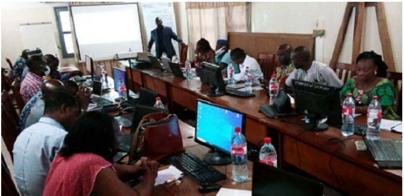
Les cadres du trésor public

Le développement des compétences et l'amélioration permanente des aptitudes professionnelles constituent des axes majeurs de management de la Direction générale du Trésor et de la Comptabilité publique (DGTCP) pour l'atteinte des objectifs fonctionnels.