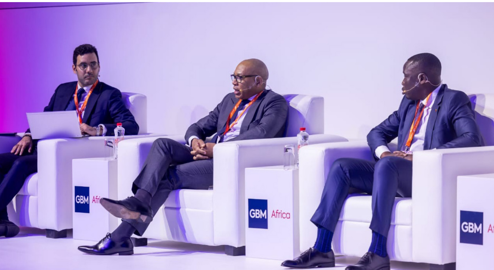
Panel sur le thème "Benin, a benchmark issuer on the WAEMU financial market"

Le Bénin a réaffirmé son statut d'émetteur de référence et sa crédibilité économique lors du Global Banking & Markets Africa 2026 à Cape Town, en renforçant ses liens avec les investisseurs internationaux.