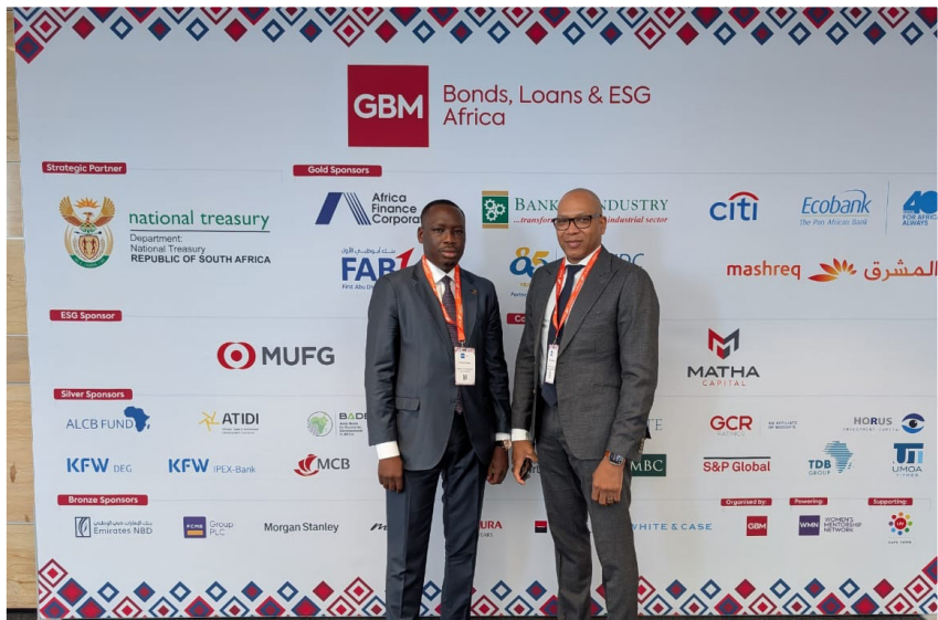
Les membres de la délégation béninoise

La participation du Bénin à ce forum international témoigne de son engagement à promouvoir la transparence, à renforcer la qualité du dialogue avec les investisseurs et à consolider son positionnement en tant qu'émetteur souverain de référence dans l'espace UEMOA.