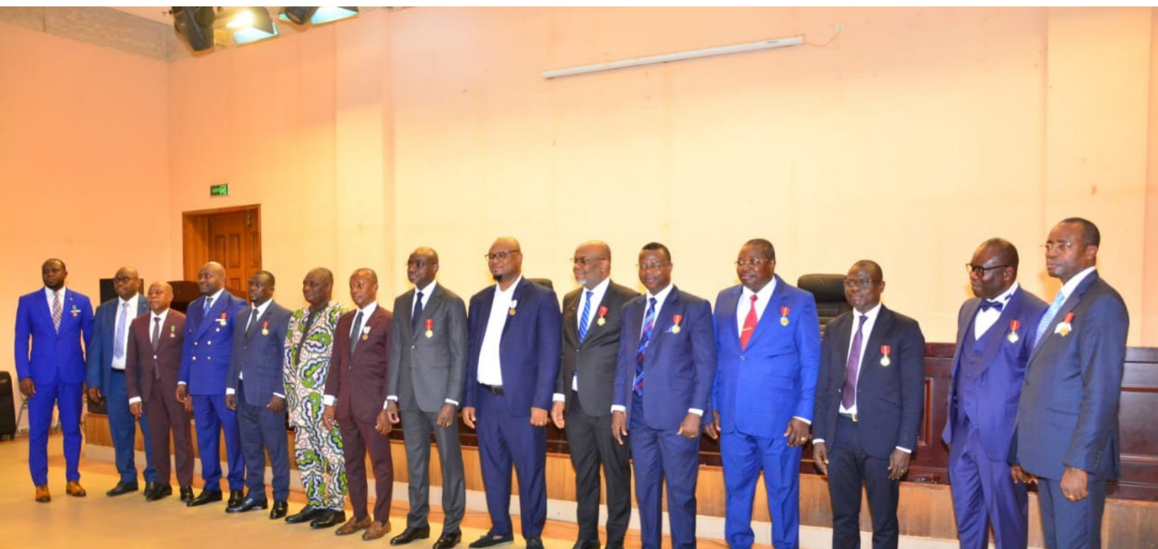
Photo de famille des récipiendaires avec la Direction générale

La République a honoré l'intégrité et le sens du devoir de douze (12) agents du Trésor lors d'une cérémonie célébrant le service public exemplaire.